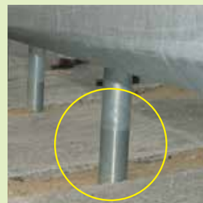
ガードレール支柱地際部